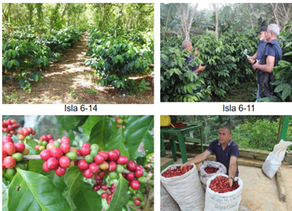
Figura 1. Variedades de Coffea arabica L.

En la actualidad, el país destina más de 60 mil hectáreas al cultivo del café en zonas montañosas. De esta superficie, el 56 % corresponde a la especie C. arabica y el 44 % a C. canephora . Se estima que alrededor de 42 mil hectáreas están en producción (MINAGRI, 2017), Durante los últimos 10 años, el acopio promedio ha sido mayor a 7 mil toneladas, con una disminución en las exportaciones y un incremento de la importación que supera los 20 millones de dólares anuales (Legra, 2019).