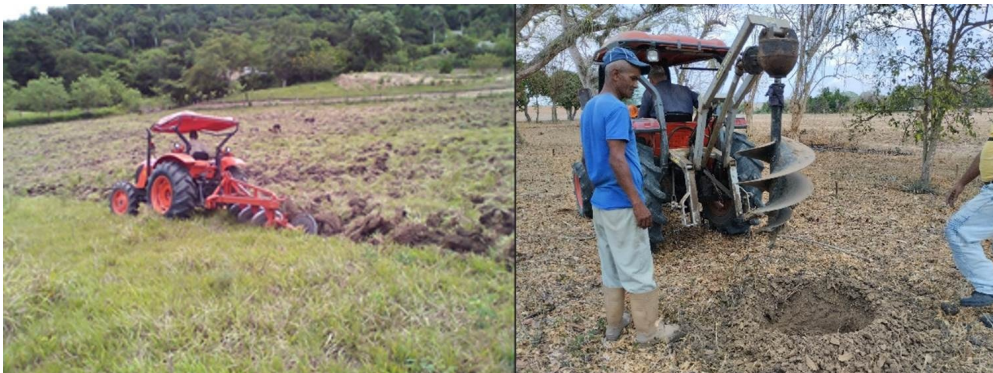
Figura 6. Labores culturales de forma mecanizada.

Estas estrategias han reducido la necesidad de trabajo manual, lo que ha resultado en incrementos significativos en los rendimientos y volúmenes productivos. Como consecuencia, se ha elevado el nivel adquisitivo de los productores y sus familias. Además, las capacitaciones impartidas a directivos, técnicos, obreros y pobladores han permitido la apropiación de nuevas tecnologías, garantizando la pertinencia y sostenibilidad del proyecto.