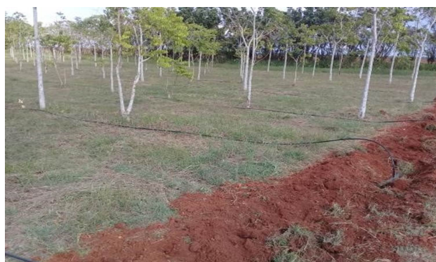
Figura 5. Áreas bajo riego.

El programa de desarrollo cafetalero en el llano, vigente para el período 2016-2030, prevé incrementar las plantaciones y los rendimientos de manera sostenida. Este programa contempla el desarrollo de varios polos productivos en el país, los cuales están incluidos dentro de las 63 medidas implementadas por el Ministerio de la Agricultura en 2021. Además, se articula con la Ley de Soberanía Alimentaria y Seguridad Alimentaria y Nutricional (Ley 148 de 2022), que establece entre sus líneas estratégicas la elaboración de programas de producción de café en todos los municipios del país.