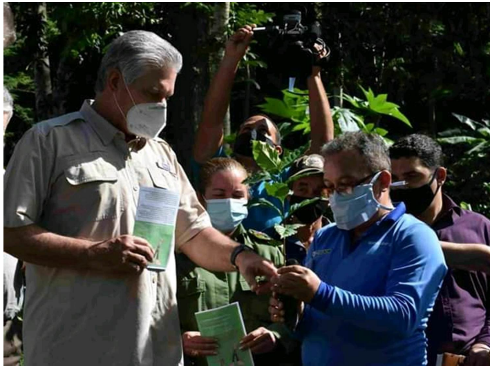
Visita del presidente de la República de Cuba Dr. Miguel Mario Díaz-Canel Bermúdez a la Unidad de Ciencia y Técnica de Base Jibacoa.