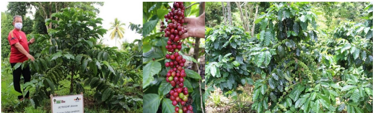
Figura 3. Coffea canephora Pierre ex A. Froehner. Variedades vietnamitas.

También es relevante la aplicación de tecnología de riego para inducir floraciones y mitigar los efectos negativos de la reducción de los niveles de precipitación y el aumento de la temperatura.