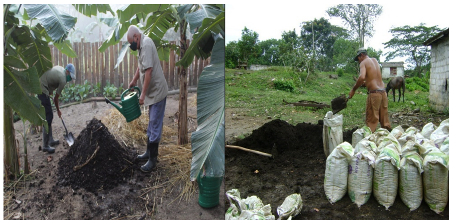
Figura 8. Abonos orgánicos locales para producir posturas de café.

la tecnología de viveros en tubetes, estos se llenan con un sustrato con un 50% de humedad, compuesto por una mezcla en proporción 1:1 (v/v) de suelo y abono orgánico. Si se cuenta con fertilizante químico, se adiciona al sustrato el equivalente a 2 g por tubete, preferentemente utilizando fertilizantes de liberación controlada, como Multicote.