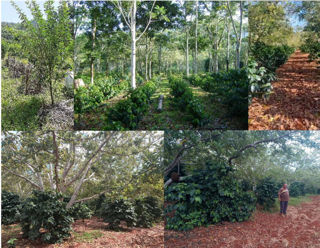
Figura 7. Cultivo de café bajo de Cajanus cajan (gandul), Khaya nyasica (caoba africana) y Persea americana (aguacate).

Se están estudiando diferentes marcos de plantación en el cultivo del café. Asimismo, se han implementado prácticas de policultivo, asociando el café con especies como maíz ( Zea mays ), frijol ( Phaseolus vulgaris ), canavalia ( Canavalia ensiformis ) y crotalaria ( Crotalaria juncea ). En los realengos, se han plantado frutales, coco y plátano de porte bajo. Además, se han dejado surcos de barbecho para evaluar el efecto de los diferentes cultivos sobre el desarrollo del café, determinando la producción, el rendimiento y el impacto económico de cada sistema de cultivo.