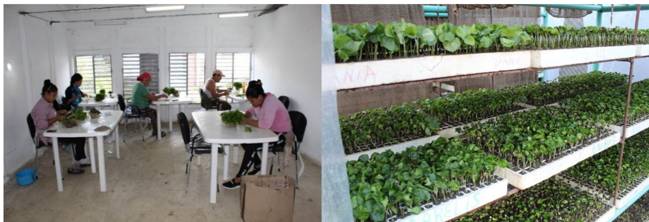
Figura 4. Centro de injerto y local empleado para la fase de aclimatación de los fosforitos.

mitigan los efectos de los períodos prolongados de déficit hídrico. Además, estos sistemas contribuyen a la fijación de nitrógeno, al mantenimiento de la fertilidad del suelo y a la reducción de la erosión. También favorecen el reciclaje de nutrientes, aportan una gran cantidad de materia orgánica y se consideran un modo de producción estratégico orientado al desarrollo sustentable de los productores (Ruiz et al., 2020). Esto permite adoptar un enfoque de economía circular que implica evitar el consumo excesivo de insumos, así como fomentar la práctica de compartir, arrendar, reutilizar, reparar, renovar y reciclar los materiales y productos disponibles en cada finca durante el mayor tiempo posible (Arroyo, 2018).